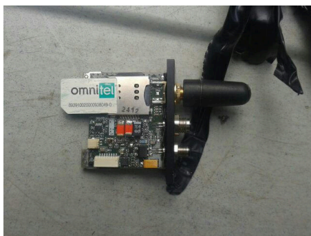
Un dispositif avec carte SIM trouvé dans un véhicule en Italie, en août 2019 5 .