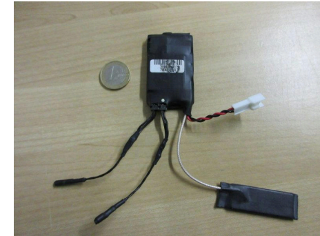
Micros trouvés dans une prise électrique dans un bâtiment à Bologne, Italie, en janvier 2018 1 .

Les dispositifs de surveillance physique dissimulés sont généralement utilisés par les agences de maintien de l'ordre et de renseignement pour obtenir des informations sur une cible lorsque les méthodes de surveillance traditionnelles sont insuffisantes. Par exemple, si un suspect ne discute jamais de sujets sensibles au téléphone, ce qui rend la surveillance de son téléphone inutile, les forces de l'ordre peuvent avoir recours à l'installation d'un microphone caché au domicile du suspect, dans l'espoir de capter des conversations intéressantes. Dans de nombreux pays, l'installation de tels dispositifs est réglementée par la loi et doit être approuvée par un juge. Les dispositifs sont souvent installés pour de la surveillance à long terme et peuvent rester en place pendant des semaines, des mois ou des années avant d'être retirés ou, dans certains cas, découverts par les personnes