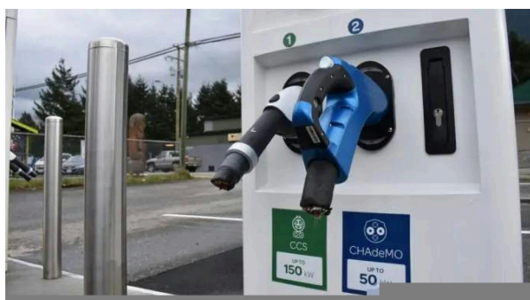
Station de recharge de véhicules électriques dont les câbles ont été sectionnés.

Plus il y a de voitures Tesla sur les routes, plus le réseau de surveillance de l'État s'étend ; la prétendue ligne de démarcation entre « citoyen » et « flic » s'efface. La technologie de surveillance mise au point par Tesla est reprise par d'autres constructeurs automobiles et fabricants de pièces détachées. Une nouvelle fonction de BMW permet aux utilisateurs de générer un rendu 3D en direct des abords de leur voiture grâce à une application pour smartphone. D'autres entreprises ne sont pas en reste et annoncent des fonctions similaires au « mode sentinelle » de Tesla.