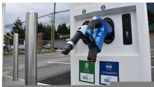
Station de recharge de véhicules électriques dont les câbles ont été sectionnés.

Plus il y a de voitures Tesla sur les routes, plus le réseau de surveillance de l'État s'étend ; la prétendue ligne de démarcation entre « citoyen » et « flic » s'efface. La technologie de surveillance mise au point par Tesla est reprise par d'autres constructeurs automobiles et fabricants de pièces détachées. Une nouvelle fonction de BMW permet aux utilisateurs de générer un rendu 3D en direct des abords de leur voiture grâce à une application pour smartphone. D'autres entreprises ne sont pas en reste et annoncent des fonctions similaires au « mode sentinelle » de Tesla.