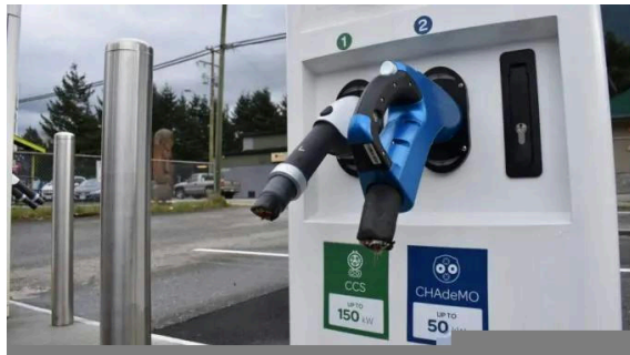
Station de recharge de véhicules électriques dont les câbles ont été sectionnés.

Plus il y a de voitures Tesla sur les routes, plus le réseau de surveillance de l'État s'étend ; la prétendue ligne de démarcation entre « citoyen » et « flic » s'efface. La technologie de surveillance mise au point par Tesla est reprise par d'autres constructeurs automobiles et fabricants de pièces détachées. Une nouvelle fonction de BMW permet aux utilisateurs de générer un rendu 3D en direct des abords de leur voiture grâce à une application pour smartphone. D'autres entreprises ne sont pas en reste et annoncent des fonctions similaires au « mode sentinelle » de Tesla.